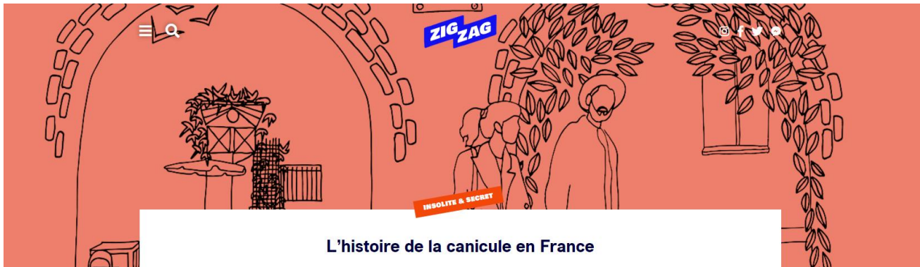
L'histoire de la canicule en France

Si les dérèglements climatiques ont évolué au fil des siècles, la canicule qui nous frappe aujourd'hui de plein ..... 41a n'est pas un phénomène propre au XXI ème siècle. Dès le XII ème , le thermomètre s'affola, et la Sarthe fut par exemple complètement asséchée ! La chaleur devenait une cause dont les conséquences étaient le plus à craindre : ainsi, lors des ..... 42a épisodes caniculaires des étés 1718 et 1719, il n'y eut pas moins de 700.000 morts... à cause des eaux impropres à la consommation ! Effectivement, le niveau des eaux étant abaissé par les chaleurs, les méandres devenaient ..... 43a et infectés par toute sorte de maladies qu'il était difficile à identifier, et donc, à soigner. De la même manière, les récoltes étaient directement impactées par ces dérèglements climatiques, provoquant la hausse des prix des productions et, dans le pire des cas, des disettes et des famines. Les Français, alarmés par ces situations, se tournaient vers l'État, qui proposait quelques solutions : contrôle du prix des grains, interdiction d'exporter... Si les esprits les plus échauffés se rassuraient, la canicule ne continuait pas moins de faire parler !